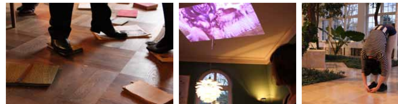
From In100Y seminar 4

Luhmann, Niklas: Kunstsystemets uddifferentiering , in: lagttagelse og paradoks , Gyldendal, 1997