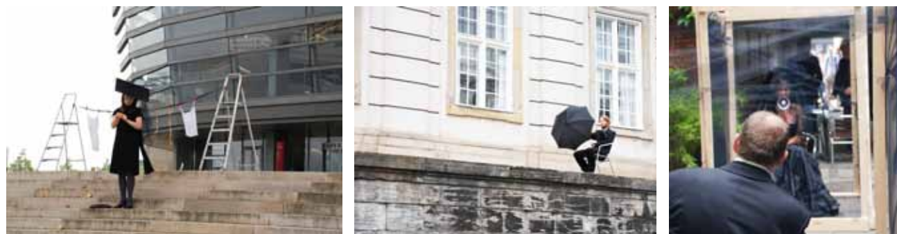
From In100Y seminar 1

Den ultimative effekt er et paradigmeskift manifesteret gennem et 'mindset-shift'. Redskabet er den kunstneriske aktivitet og udfoldelse. Denne tænkes – som en dominoeffekt – at påvirke den enkelte deltager i et dybt, gennemtrængende og transformerende øjeblik (se også betragtningerne over den signifikante begivenhed i artiklen 'The Significant Event', ISSUES 2). Deltageren agerer så igen mere bæredygtigt (forstået i 'Ackhoffsk' forstand, se senere i denne artikel), hvilket vil påvirke organisationen, samfundet og endelig selve kapitalsystemet i en mere harmonisk og bæredygtig retning for ultimativt at have transformeret eller måske opløst det totalt (Darsø: 2001, Guillet de Monthoux: 2004, Scharmer: 2007).