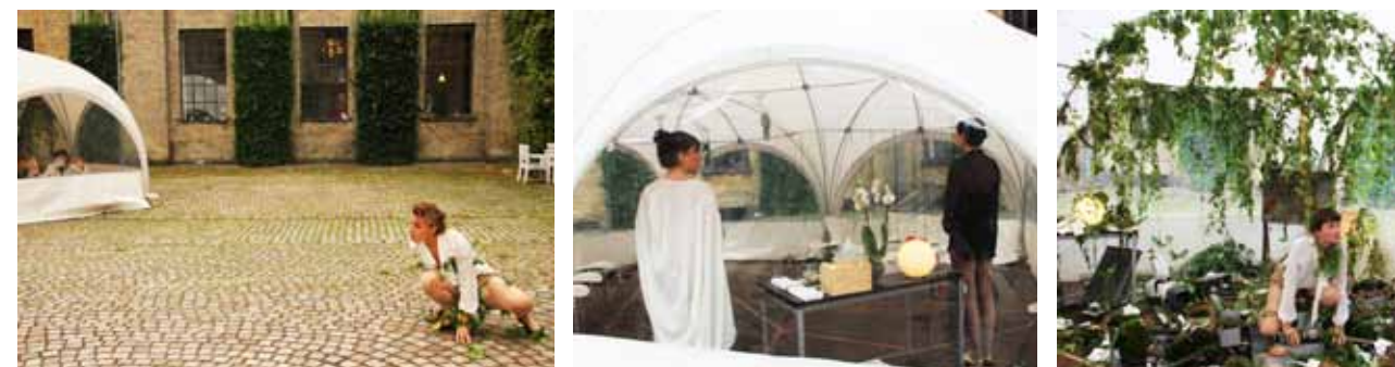
From In100Y seminar 2

'Artful creation' er altså en paradigmeskiftende strategi, der bidrager til et nyt gryende kapitalsystem, der netop